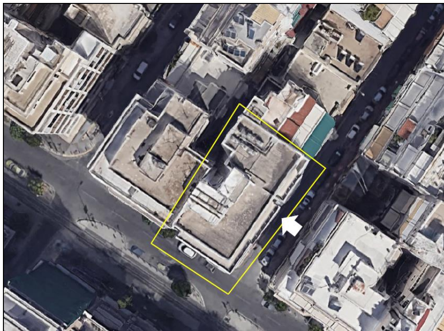
Εικόνα 2. Κτίριο Ανδρούτσου.